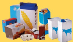
Emballages en carton et briques alimentaires bien vidés et aplatis