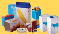
Emballages en carton et briques alimentaires bien vidés et aplatis