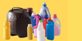
Bouteilles et flacons en plastique, alimentaire et sanitaire