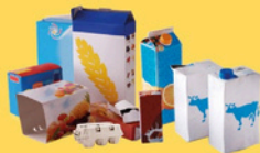
Emballages en carton et briques alimentaires bien vidés et aplatis