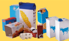
Emballages en carton et briques alimentaires bien vidés et aplatis