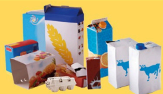
Emballages en carton et briques alimentaires bien vidés et aplatis