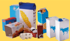
Emballages en carton et briques alimentaires bien vidés et aplatis