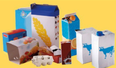
Emballages en carton et briques alimentaires bien vidés et aplatis