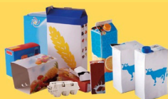
Emballages en carton et briques alimentaires bien vidés et aplatis