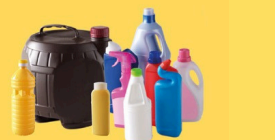
Bouteilles et flacons en plastique, alimentaire et sanitaire