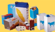
Emballages en carton et briques alimentaires bien vidés et aplatis